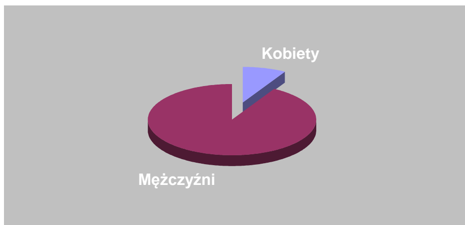
Wykres 1. Struktura osób, które ukończyły szkolenie w 2019 roku ze względu na płeć.

Spośród osób, które ukończyły szkolenie w 2019 roku 91,7 % stanowili mężczyźni, a 8,3 % kobiety.