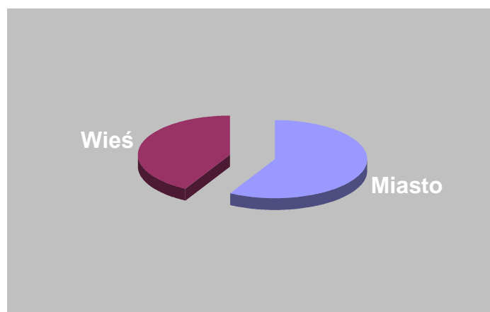
Wykres 4. Struktura osób, które ukończyły szkolenie w 2019 roku ze względu na miejsce zamieszkania.

Spośród osób, które ukończyły szkolenie w 2019 roku 58% stanowiły osoby zamieszkałe w mieście, a osoby zamieszkałe na wsi 42%.